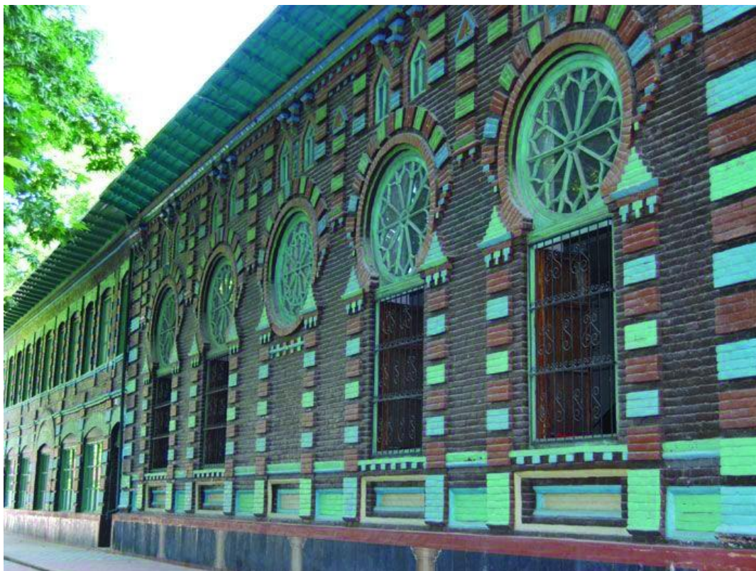
Şəkil 5. Yuxarı məscid. Göyçay şəhəri. XIX-XX əsrin əvvəlləri