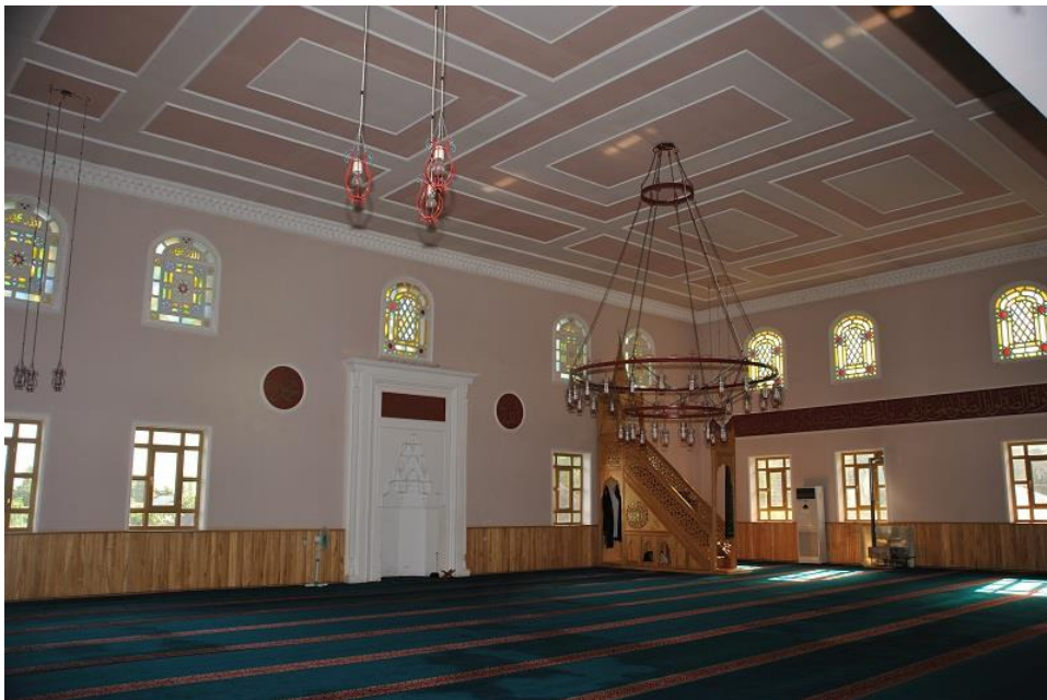
Şəkil 4. Mərkəz məscidi. Göyçay. XIX-XX əsrin əvvəlləri