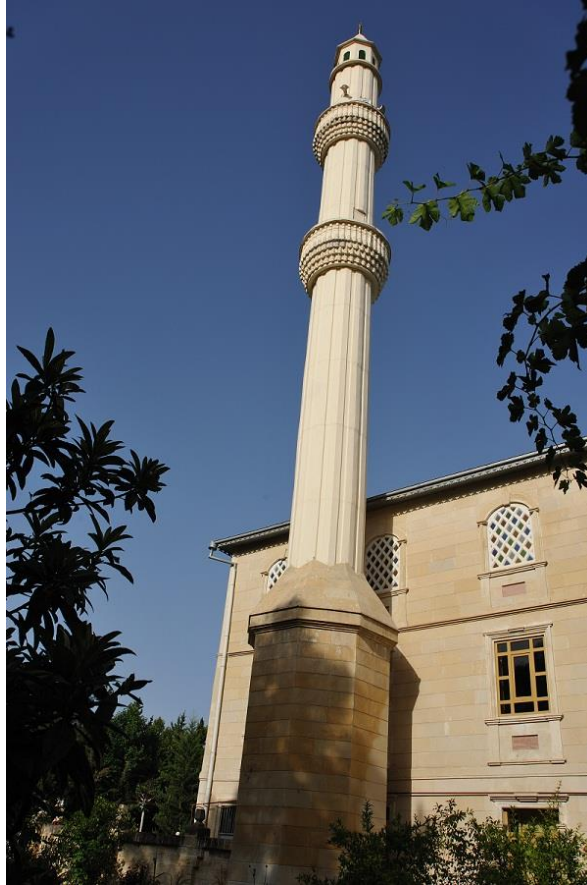
Şəkil 3. Hacı Məhəmməd ağa məscidi. Ağdaş