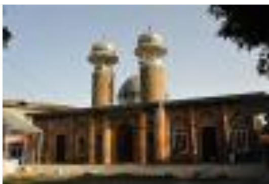
Şəkil 2. İmamzadə məscidinin plan və fasadı. XIX əsr. Şamaxı şəhəri Azərbaycan Respublikası, Dövlət Tarix Arxivi, Fond № 290, siyahı 1, iş 52