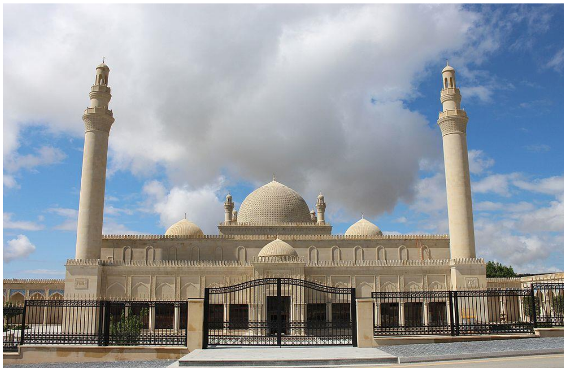
Şəkil 1. Şamaxı Cümə məscidi. Şamaxı şəhəri