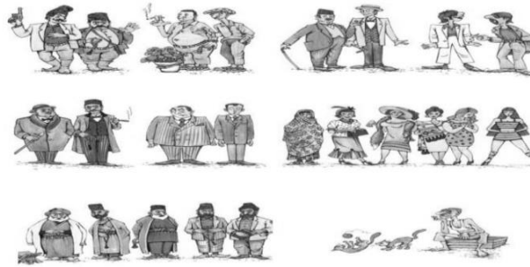
Şəkil 3. Bayram Hacızadə “Bizim tiplər dünən və bu gün” (“Kirpi”, 2005).

“Molla Nəsrəddin” və molla-nəsrəddinçilər” sərgisində B.Hacızadənin “Biz, yüz il əvvəl və bu gün” başlığı altında “Milləti-biçarənin dərindən çəkməkdən əriyib çöpə döndüm...”, “Niyə bu xalq başına özgə papağı qoyur”, “Bizim tiplər dünən və bugün”, “Qarabağ mahalında məktəblər”, “Pirlərimiz”, “Geyimlərimiz dünən və bu gün” adlı silsilə karikaturaları nümayiş olunmuşdur. Bu rəsmlərdə müəllifin xalqın milli mentallığına yaxından bələd olması, onun xarakterik cəhətlərini dərinlən bilməsi aydın görünür. Rəssam, bu əsərlərində nadanlıq, savadsızlıq, xalqın bu vəziyyətinə “millət atalarının” laqeydliyini kəskin və ifşaedici satira ilə tənqid edir. Acı gülüslə aşılınmış karikaturalarında dövrün real həqiqətlərini işıqlandıran B.Hacızadə, bu əyintilərin aradan qaldırılmasının vacibliyini ön plana çəkir, son yüz ildə itirdiklərimizi və qazandıqlarımızı müqayisə edir. Əsasən enli, qara kontur xətlər vasitəsi ilə plastik fiqur və formalar yaradan rəssam, bədii estetik səviyyəsi və yüksək professionallığı ilə seçilən karikaturaların müəllifi kimi tanınır (şəkil 3).