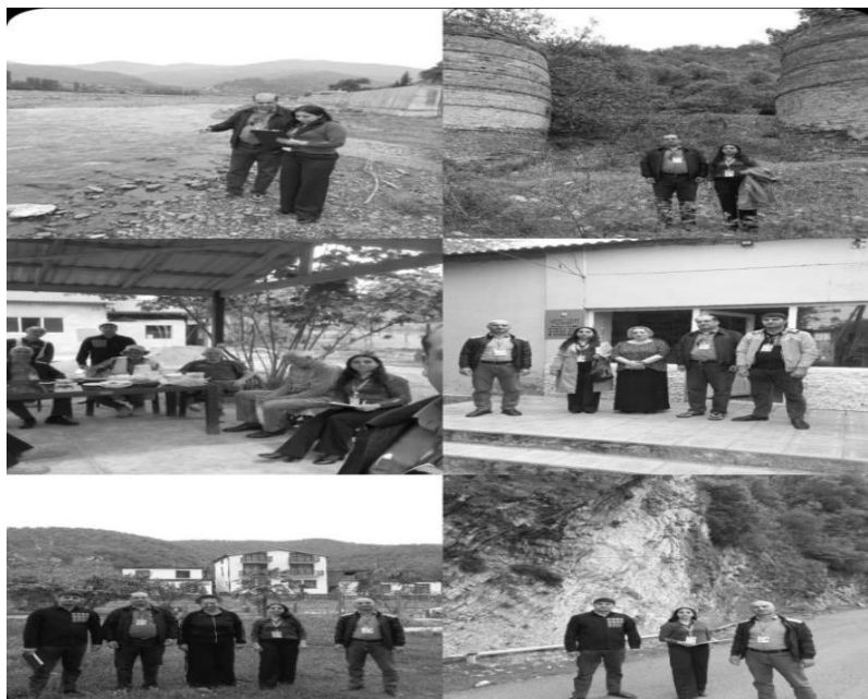
Şəkil 1. AMEA Şəki REM-in Ekoloji Coğrafiya şöbəsinin əməkdaşlarının Zaqatala (Car, Qəbizdəre, Mazıx) rayonunda turizm obyektlərinin tədqiqi fəaliyyətindən görüntülər (23-24.04.2025)

Tədqiqatın informasiya bazasını Azərbaycan Respublikasının dövlət orqanları tərəfindən təqdim olunan rəsmi sənədlər, müvafiq prezident fərman və sərəncamları, eləcə də sektorla bağlı dövlət proqramları təşkil etmişdir. Əldə olunan ilkin məlumatlar əsasən Azərbaycan Respublikası Dövlət Statistika Komitəsinin (AR DSK) rəsmi statistik göstəricilərindən, Zaqatala Turizm İnformasiya Mərkəzindən, Zaqatala Rayon Statistika İdarəsindən, həmçinin Zaqatala şəhər inzibati ərazi dairələri üzrə icra nümayəndəlikləri ilə aparılan müsahibələrdən əldə olunmuşdur. Bununla yanaşı, yerli idarəetmə orqanlarının illik hesabatları və turizm sektoru üzrə fəaliyyət göstərən müəssisələrin təqdim etdiyi məlumatlar da araşdırmaya daxil edilmişdir. Rayonun turizm imkanlarının daha dolğun və obyektiv qiymətləndirilməsi məqsədilə Mazıx, Qəbizdəre və Car ərazilərində sahə müşahidələri həyata keçirilmiş, yerli əhali və turizm sektorunun iştirakçıları arasında rəy sorğuları aparılmışdır.