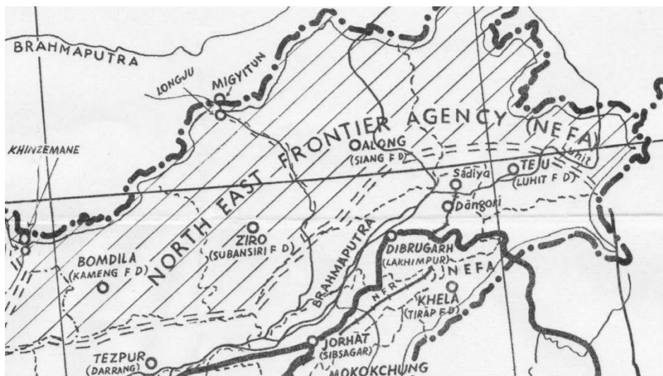
Şəkil 1. Mak-Maqon xətti və NEFA əraziləri 1959-cu ildə

Çin ilə Hindistan arasında münasibətlərin gərginləşməsi fonunda 1959-cu ildə Tibetdə üsyan baş verdi. Üsyan zamanı Tibetin dini və siyasi lideri Dalay Lamanın Hindistana qaçması Çin-Hindistan sərhəd xəttindəki gərginliyi daha da artırdı. Tibet hadisələrinin baş verməsində C.Nehru hökuməti və ABŞ hakim dairələrini günahlandıran Çin rəhbərliyi Hindistana qarşı ərazi iddiaları irəli sürməyə başladı [8, s. 273]. Bununla Çin-Hindistan münasibətlərində bir müddətlik arxa plana keçmiş ərazi mübahisələri məsələsi XX əsrin 50-ci illərinin sonunda yenidən aktuallaşdı. İki dövlət arasında ərazi mübahisələrinin daha çox gərgin olduğu ərazilər Qərb sərhəd sektorunda yerləşən Aksay-Çin və Şərq sərhəd sektorunda yerləşən və sonradan Arunaçal-Pradeş (Cənubi Tibet) adlandırılan Şimal-Şərq Sərhəd Agentliyi (North-East Frontier Agency - NEFA) əraziləri olmuşdur (Şəkil 1).