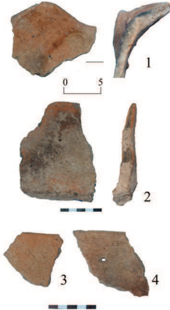
Şəkil 3. İkinci qrupa aid qəhvəyi rəngli keramika.

can və Yaxın Şərqi abidələrindən məlumdur. Zirincli, Şorsu və Yumru Sürümçəkdən aşkar olunan keramika nümunələrində daraqvarı alətin izlərinə az rastlanmışdır.