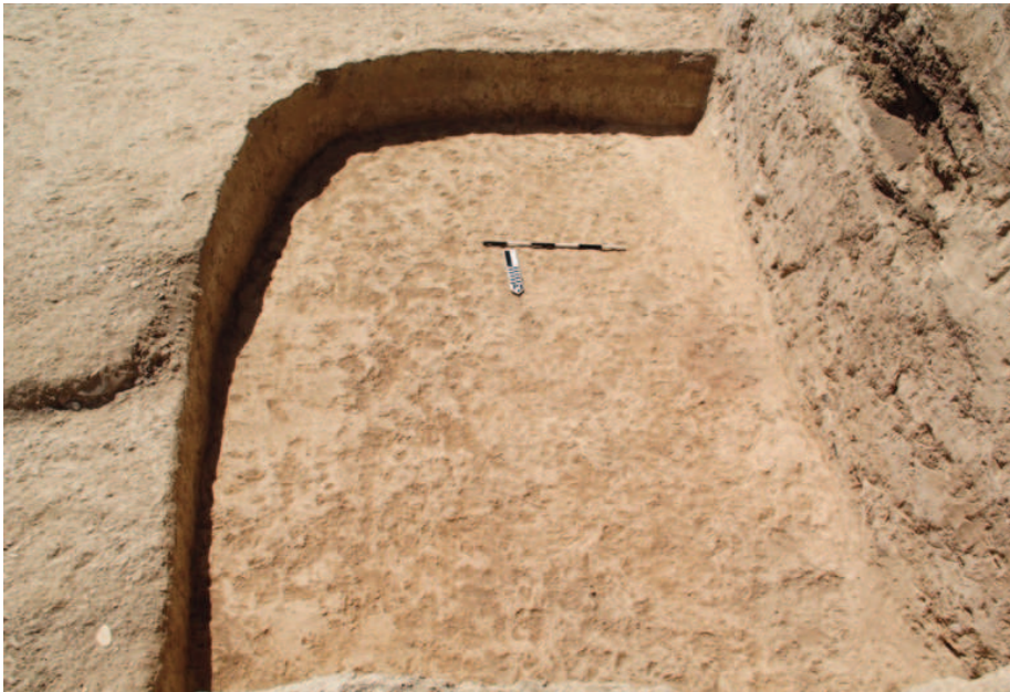
Şəkil 1. Dördüncü sahədə (D) aşkar olunan yarımqazmanın qalığı.

A və B sahələri qalın tikinti qalıqları ilə örtüldüyündən bu sahələrdə qazıntının davam etdirilməsi məqsədəuyğun hesab edilmədi. Yalnızca B sahəsindəki 5×5 m sadə tədqiqat xam torpağadək davam etdirildi.