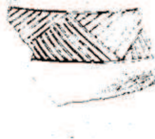
Şəkil 2. I Maxta [Aşurov S. tablo XXIII].