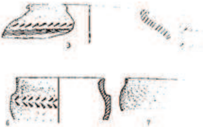
Şəkil 3. Kolanı [Baxşəliyev V., 2002, şəkil 23]