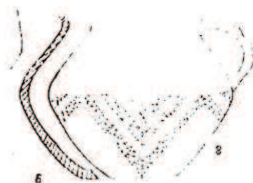
Şəkil 5. Qızılburun [Baxşəliyev V., 2004, şəkil 43: 8]