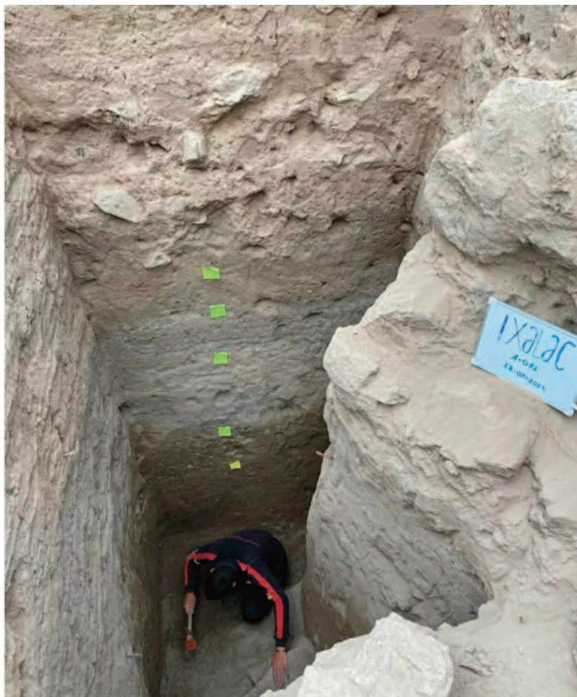
Şəkil 2. IXA sahəsindəki şurf.

Qazıntı sahəsinin ən qalın təbəqəsinin tapıntıları daş qutu qəbirə, daş divar qalıqlarına və boz-qara rəngli parlaq cilalı keramika nümunələrinə aid qalıqlar təşkil edir ki, bu da Erkən Dəmir dövrü təbəqəsini kompleks halda tədqiq etməyə imkan verir.