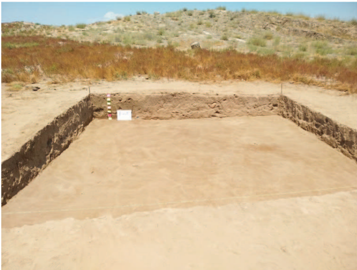
Şəkil 1. I XA sahəsində qumlu təbəqə.

Qum qatını keçib altdakı mədəni təbəqələri tapmaq məqsədi ilə qazıntı sahəsi 2 hissəyə ayrıldı və şimal yarısında qazıntılar dərininə doğru davam etdirildi. Təqribən 1,2 metr dərinlikdə qumlu qat sarı rəngli torpaq təbəqə ilə əvəz olunmağa başladı. Bu təbəqədə keramikanın miqdarı artsa da müxtəlif dövrləri əks etdirməsi mədəni təbəqənin qarışdığından xəbər verirdi. Ehtimal ki, Orta əsrlər dövründə buradan qəbiristanlıq kimi istifadə edilmiş və məhz bu səbəbdən təbəqələr dağdılmışdı. Bu fikir qarışıq halda üzə çıxarılan skelet qalıqları ilə də təsdiqlənirdi. Qarışıq təbəqə çox da qalın deyildi və 1,5 metrdən sonra qırmızı rəngli təbəqə ilə əvəz olundu. Bu qat Dəmir dövrünə aid nümunələrin çoxluğu ilə fərqlənirdi. Təqribən 2,8-3,5 metr dərinlikdə torpağın rənginin açıq yaxud solğun yaşıl rəngə doğru dəyişdiyi izlənilirdi. Bu təbəqədən Kür-Araz mədəniyyətinin boz rəngli, dairəvi batıqlı və digər əlamətlərini daşıyan keramika fraqmentləri üzə çıxarıldı. Onlardan alt təbəqədə boyalı qab çeşidləri üzə çıxmağa başlamışdı. Qazıntı mövsümünün başa çatmasını nəzərə alaraq, sahədə 2×2 ölçüsündə şurfda qazıntılar 4 metr dərinliyə çatdırıldıqda keramika miqdarı azalmış, küllü təbəqə nəm torpaq qatı ilə əvəz olunmuşdu. Şurfda təbəqələrin bir-birini əvəz etməsi torpağın rənginin dəyişməsi şəklində aydın izlənilir (şəkil 2).