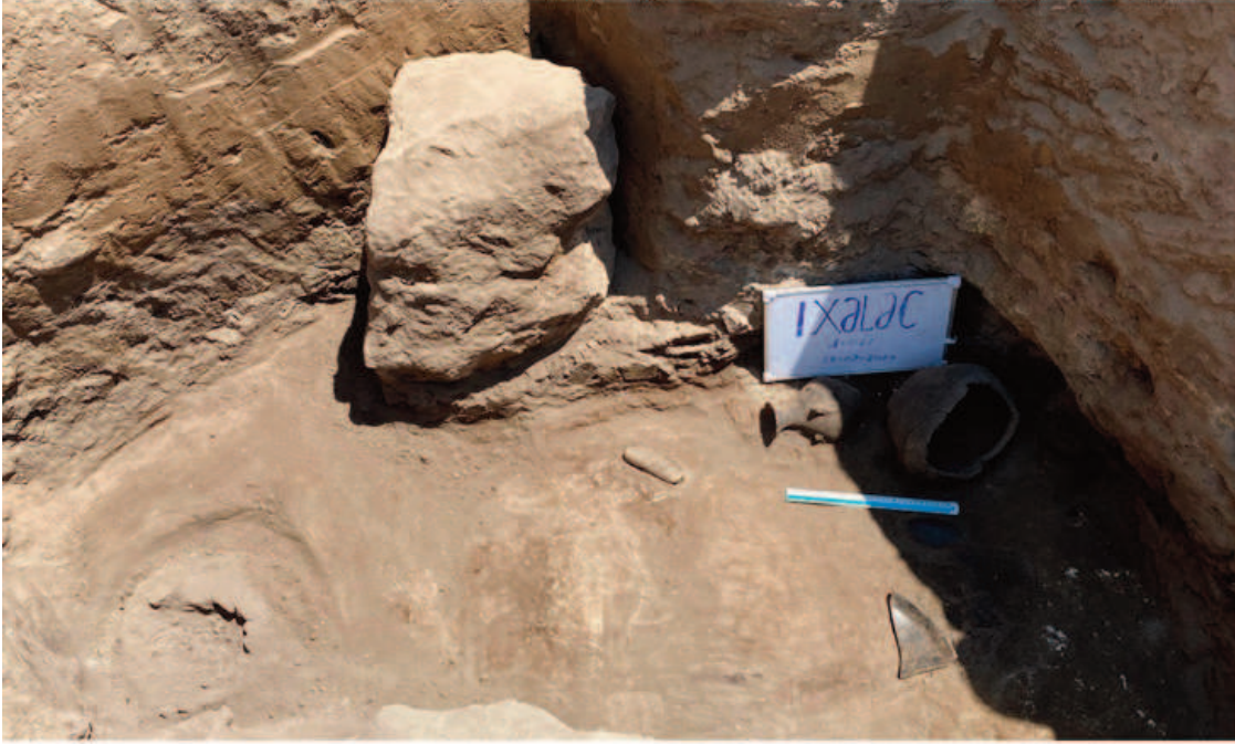
Şəkil 3. IXA sahəsindəki daş qutu qəbirin avadanlıqları.

yuvarlaq qabartma ornamentlər və qulpu olan qara rəngli kiçik küpədir. İkincisi çömlək tipli qabdır. Ağzı qərbə doğrudur. Çox kövrəkdir, səthi çərtmələrlə naxışlanıb. Üçüncüsü parlaq cilalı iri fraqmentlər halındadır (şəkil 3).