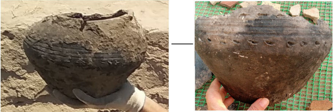
Şəkil 3. Dəmir dövrünə aid çölmək (I Xələc-2024).