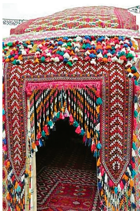
Рис. 4. Оформление входа в юрту.