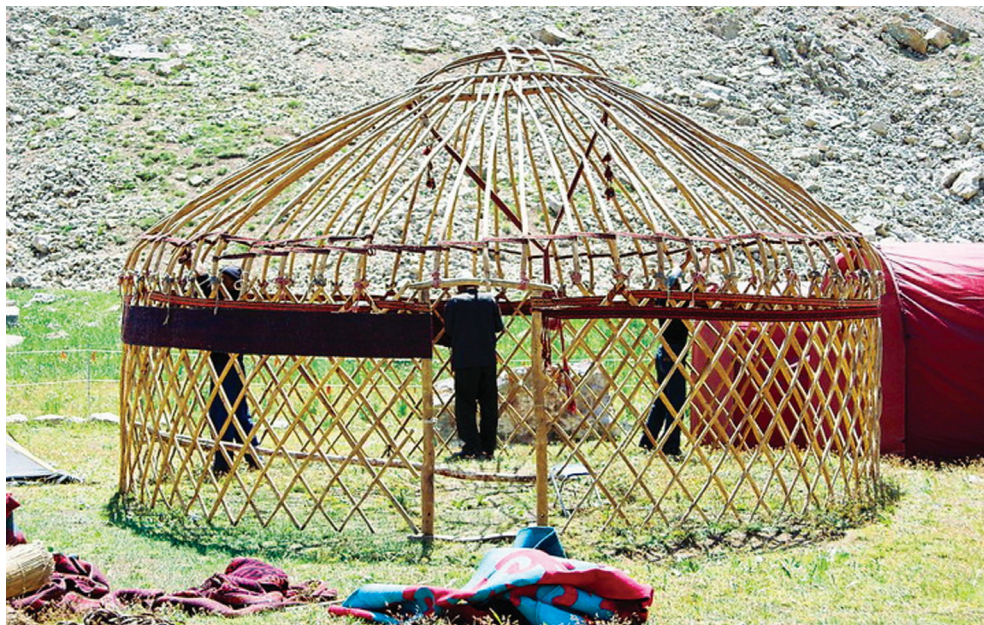
Рис. 2. Конструкция юрты.