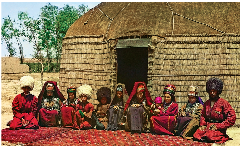
Рис. 1. Туркменская юрта. Общий вид