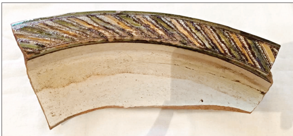
Şəkil 3. Niyazabadın XVII əsrə aid şirli keramika nümunələri