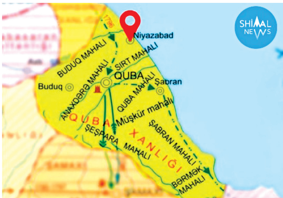
Şəkil 1. Niyazabad şəhəri (xəritə)