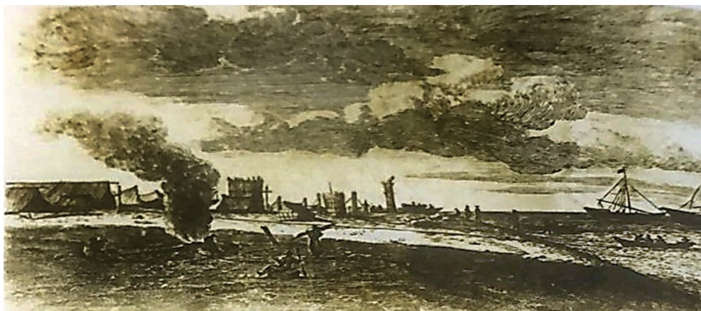
Şəkil 2. Niyazabad şəhəri. Qravür. 1636-cı il. A.Oleari