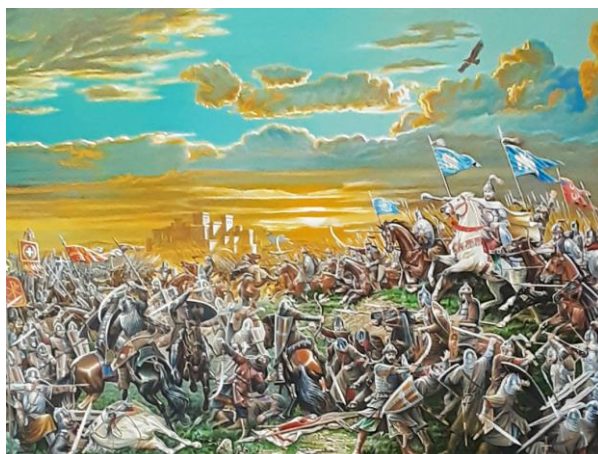
2. Camaləddin İsmayilov. “Malazgirt döyüşü” (fraqment). Kətan, yağlı boya. 2018.