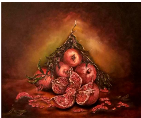
3. Pərvinə Əfəndi. “Narlar”. Kətan, yağlı boya. 2014.