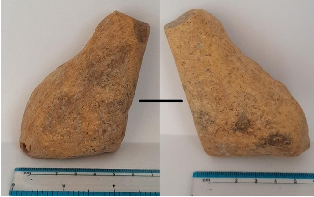
Şəkil 2. Xudutəpə yaşayış yerindən aşkar edilmiş gil fiqur (Ağalarzadə, 2023)

Daşdan hazırlanmış alətlərin də xammal növü diqqəti cəlb edir. Belə ki, Cənubi Qafqazın həmdövr yaşayış yerlərində obsidiandan hazırlanmış kəsici alətlər çaxmaq daşından olan alətlərdən dəfələrlə çoxdur. Əliköməktəpəsində isə bunun tam əksi müşahidə edilir: çaxmaq daşından alətlər obsidiandan olan alətlərdən qat-qat çoxdur. Bu vəziyyəti yalnız yaşayış yerinin obsidian yataqlarından (Kəlbəcər) nisbətən uzaq məsafədə yerləşməsi ilə izah etmək doğru olmazdı. Bu, həm də çaxmaq daşından alət hazırlanmasının yerli ənənələri ilə bağlı idi.